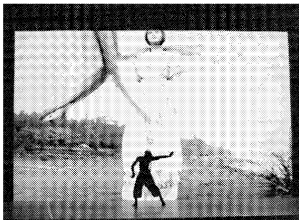
Multimedial. Chinesische Gäste tanzten im Lörracher Burghof.

«Le sacre du printemps» im Lörracher Burghof